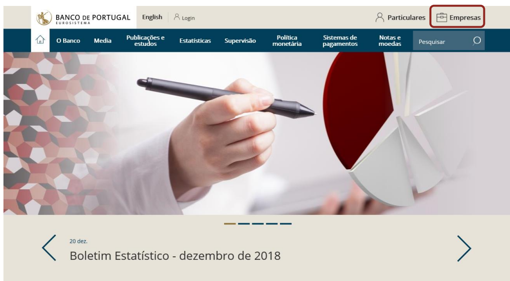
Figura I.2.3 • Acesso aos quadros da empresa e do setor (passo 1)