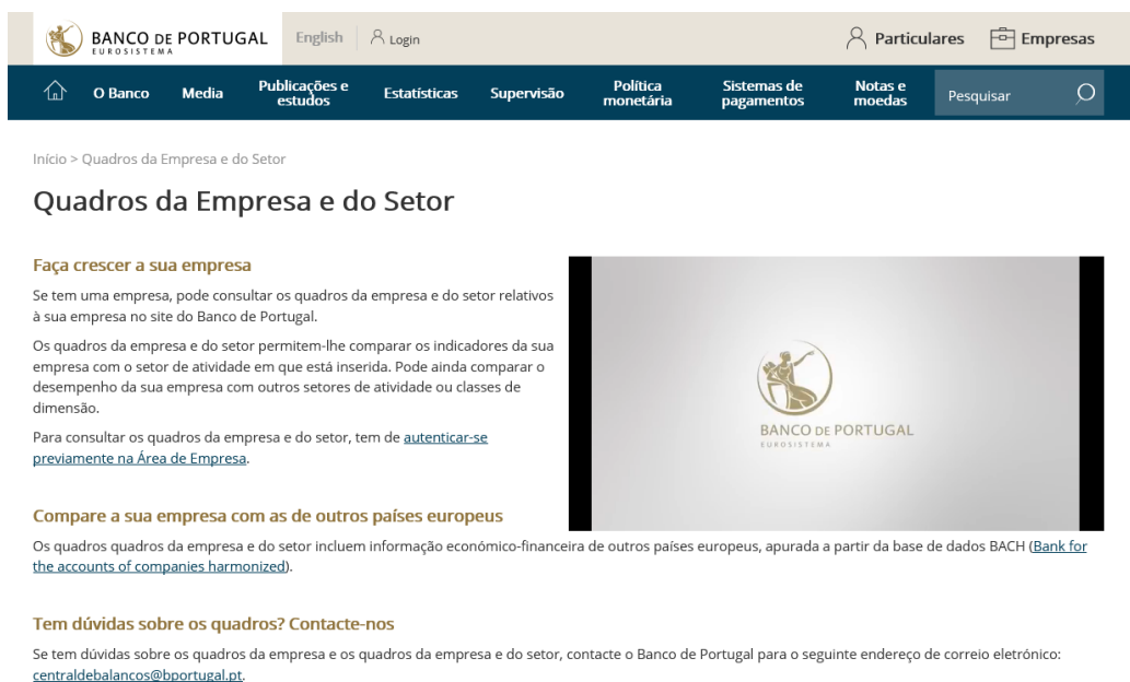
Figura I.2.4 • Acesso aos quadros da empresa e do setor (passo 2)