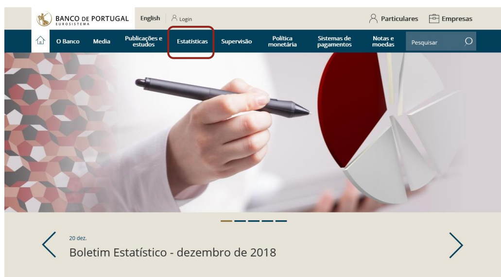
Figura I.2.1 • Acesso aos quadros do setor (passo 1)

Os QS estão disponíveis para o público em geral e podem ser acedidos através da página das Estatísticas no site do Banco de Portugal (Figuras I.2.1 e I.2.2).