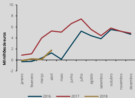
Gráfico 2 • Financiamento das administrações públicas por contraparte – transações acumuladas desde o início do ano