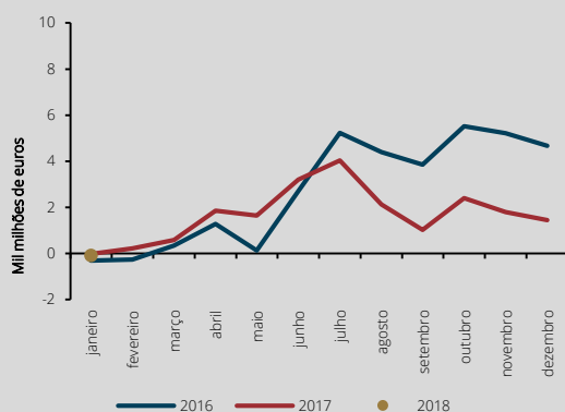
Gráfico 2 • Financiamento das administrações públicas por contraparte – transações acumuladas desde o início do ano