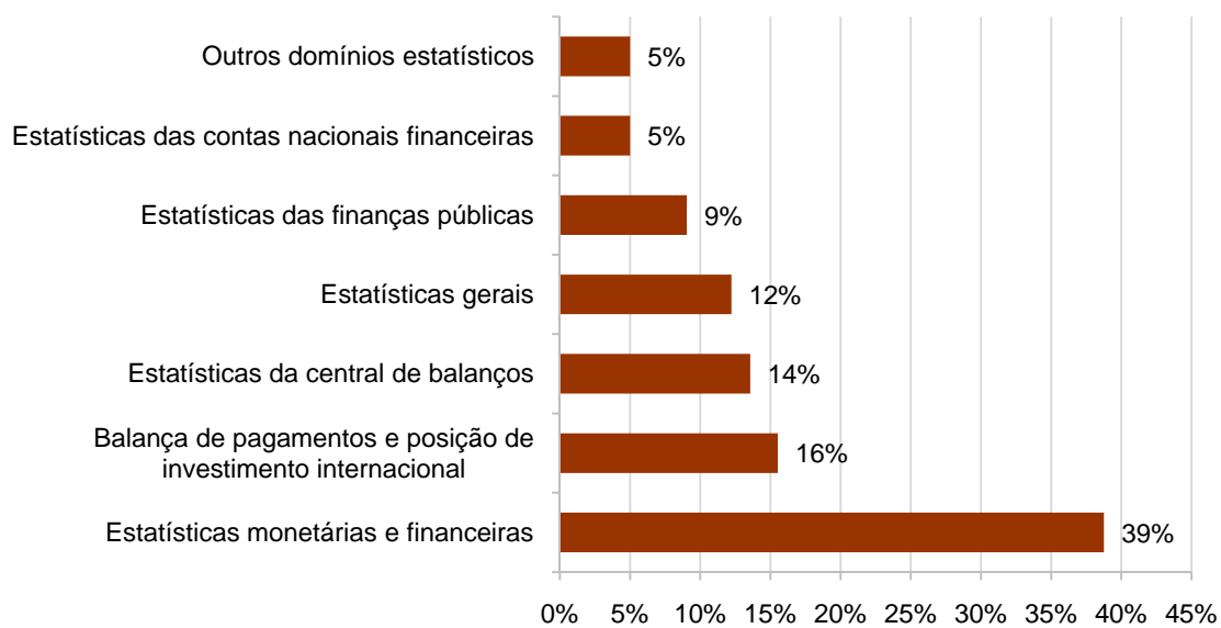
Gráfico 3 - Consultas por utilizadores registados no BPstat

As estatísticas monetárias e financeiras são as mais consultadas (39%) seguidas das estatísticas da balança de pagamentos e de PII (Gráfico 3).